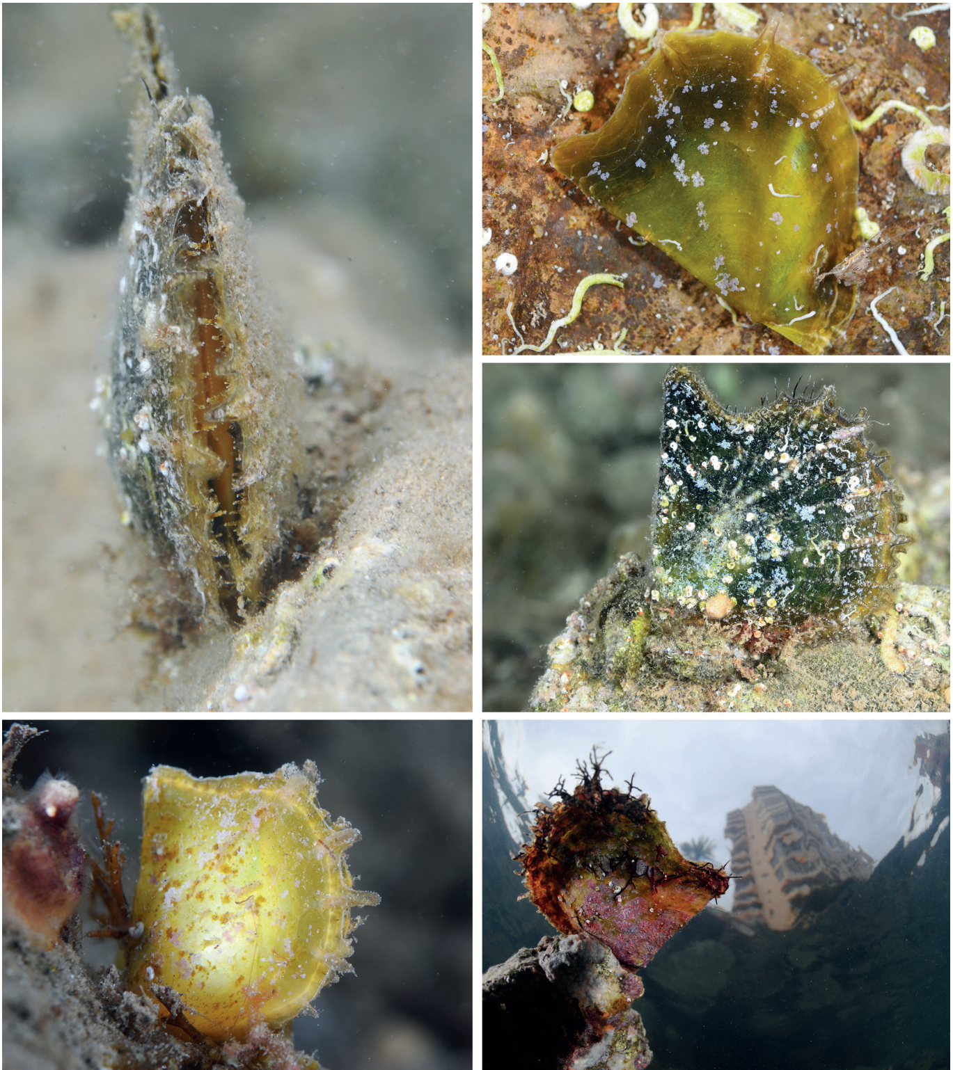
Figura 1. Fotografía in situ de ejemplares vivos de Pinctada radiata en el Canal de Marchamalo (Mar Menor).

confirmación fehaciente (por técnicas moleculares, o mediante el estudio de poblaciones con ejemplares adultos, mucho más distintivos) de que dicho taxón esté realmente presente en el Mediterráneo. Por tanto, en ausencia de datos más sólidos, todos los ejemplares de las poblaciones mediterráneas deberían asignarse provisionalmente al mismo taxón, Pinctada radiata , mientras no existan nuevos argumentos confirmatorios que permitan una asignación a un taxón diferente.